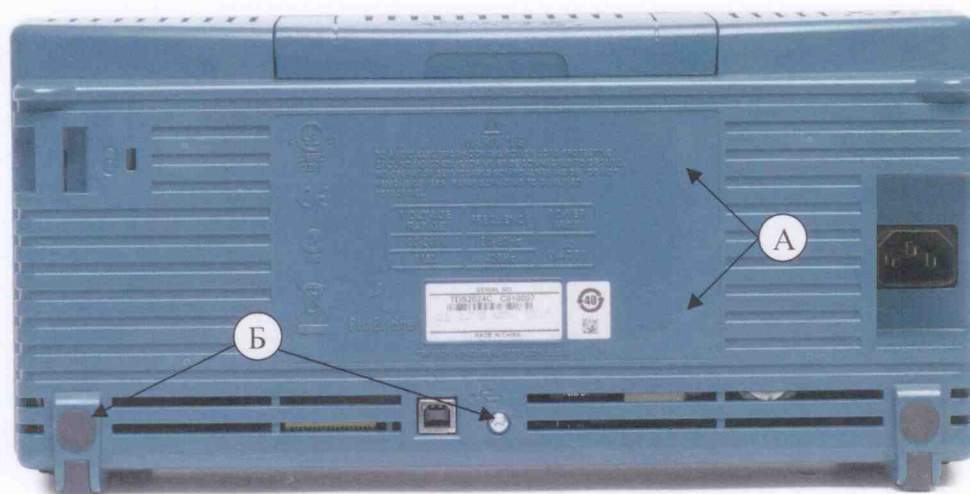
Рисунок 2 – А) Места для размещения наклеек; Б) Возможные места для пломбировки от несанкционированного